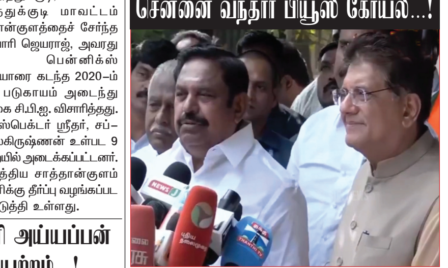
சென்னை, மார்ச். 23- தமியக கூட்டமன்ற தேர்தலுக்கு இன்னும் சரியாக 30 நாட்கள் மட்டுமே உள்ள நிலையில், பாஜக தோர்தல் பொறுப்பாளர் பியூஸ் கோயல் தமியகம் வந்துள்ளார். தேசிய ஜனநாயக கூட்டணி கட்சிகள் தொகுதி பங்கீடு பேச்சுவார்த்தை செய்கின்றதற்காக நடத்துவோம் எனவும் பியூஸ் கோயல் கூறியுள்ளார். இன்று காலை முதல் கூட்டணி கட்சிகளுக்கு ஒதுக்கப்படவுள்ள தொகுதிகளின் பட்டியல் வெளியாகவுள்ளது. மேலும் எந்த எந்த தொகுதிகள் என்ற பட்டியலும் வெளியாகும் என கூறப்படுகிறது. அடுத்ததாக இன்னும் ஒரு சில நாட்களில் வேட்பாளர்களின் பட்டியலும், தேர்தல் அறிக்கையும் வெளியாக இருப்பதாக அதிமுக வட்டார தகவலாக உள்ளது.