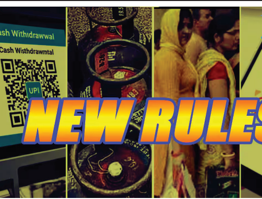
அடைந்துள்ளனர். ரேஷன் கார்டு வைத்திருப்பவர்களுக்கு குட்டி நியூஸ் ரேஷன் கடைகளில் கூட்ட நெரிசலைத் தவிர்க்கவும், ரேஷன் கிடங்குகளை முறைப்படுத்தவும் மத்திய அரசு ஒரு புதிய திட்டத்தைக் கொண்டு வந்துள்ளது. இதன் மூலம் ரேஷன் கடைகளில் ஒவ்வொரு மாதமும் கியூவில் நின்று பொருள் வாங்குவவர்களுக்கு பெரும் நிம்மதியை ஏற்படுத்தி உள்ளது.

சென்னை, மார்ச். 23- ஏப்ரல் 1 ஆம் தேதி புதிய நிதியாண்டு பிறக்கவுள்ள நிலையில், ஏடிஎம் விதிகளில் வரக்கூடிய மாற்றங்கள், ரேஷன் கார்டு அட்டைதாரர்களுக்கான குட்டி நியூஸ், டீக்கடை மற்றும் ஹோட்டல்களுக்கு விநியோகிக்கப்படும் கேஸ் சிலிண்டர் அப்டேட் மற்றும் ஆதார் அட்டையில் நீங்க செய்க்கூடாத சில முக்கியமான விஷயங்கள் என ஏப்ரல் 1 முதல் புதிய விதிகள் குறித்து பொது மக்கள் அனைவரும் கண்டிப்பாக தெரிந்து கொள்ள வேண்டிய மிக முக்கியமான அப்டேட் கள் மற்றும் தகவல்கள்