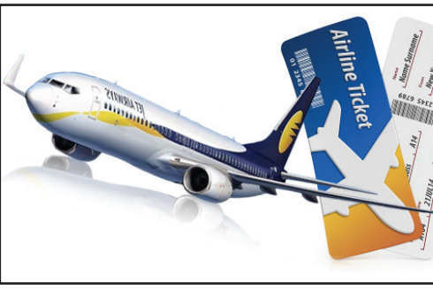
பயணிகளுக்கும் விமான நிறுவனங்களுக்கும் திடீர் பொருள் என்ன?

புதுடெல்லி, மார்ச். 23- உள்நாட்டு விமானக் கட்டணங்கள் மீது தற்காலிக உச்சவரம்புகளை விதித்து 3 மாதங்களுக்கும் மேலான நிலையில், அந்தக் கட்டுப்பாட்டை நீக்க அரசாங்கம் முடிவு செய்துள்ளது. கடந்த ஆண்டு டிசம்பரில் IndiGo விமானச் சேவையில் ஏற்பட்ட இடையூறுகளைத் தொடர்ந்து, அரசாங்கம் இந்த உச்சவரம்புகளை விதித்திருந்தது.