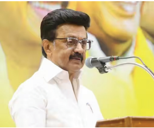
இவர்களின் கல்வி தொடர, எளிய குடும்பங்களின் அடுத்த தலைமுறைகள் செழிக்க திருகவுக்கு ஒட்டளிக்க வேண்டும். திராவிட மாடல் ஒன்றாக வெவ்வேறான இவ்வாறு முதல்வர் ஸ்டாலின் கூறியுள்ளார்.

சென்னை, மார்ச். 23- உயர்கல்விக்கு ஊன்றுகோலாக அமைந்துள்ளது தமிழ்ப்புதல்வன் திட்டம் என முதல்வர் ஸ்டாலின் தெரிவித்துள்ளார். தமிழ்ப்புதல்வன் திட்டத்தால் பயனடைந்தவர்களின் வீடியோ சமூக வலைதளத்தில் வெளியிட்டு, முதல்வர் ஸ்டாலின் வெளியிட்டுள்ள பதிவில் கூறியிருப்பதாவது: இந்தத் திட்டம் மட்டுமல்ல, இதுபோல லட்சக்கணக்கான தம்பிகளின் உயர்கல்விக்கு ஊன்றுகோலாக அமைந்துள்ளது தமிழ்ப்புதல்வன்.