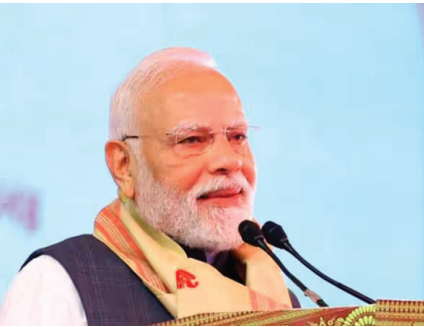
பிரதமர் மோடி எக்ஸ் தளத்தில் ஒரு பதிவை போட்டுள்ளார். அதில், 'பாரத மாதாவின வீரப்பதவர்களான பகத்சிங், ராஜ்குரு மற்றும் சுக்தேவ் ஆகியோரை இன்று நாம் மிகுந்த மரியாதையுடன்

புதுடெல்லி, மார்ச். 23- தியாகிகள் தினத்தையொட்டி பகத்சிங், ராஜ்குரு மற்றும் சுக்தேவ் ஆகியோரின் வீரத்தைப் போற்றி பிரதமர் மோடி தனது எக்ஸ் தளத்தில் பதிவிட்டுள்ளார். சுதந்திரப் போராட்ட வீரர்கள் பகத்சிங், சிவராம் ராஜ்குரு மற்றும் சுக்தேவ் தாயார் ஆகிய மூவரும் 1931ம் ஆண்டு மார்ச் 23ம் தேதி லாகூர் சிறையில் தூக்கிலிடப்பட்டனர். இவர்களின் தியாகத்தைப் போற்றும் வகையில், ஆண்டுதோறும் மார்ச் 23ம் தேதி தியாகிகள் தினம் கடைபிடிக்கப்படுகிறது. இந்த நிலையில், தியாகிகள் தினத்தையொட்டி, பகத்சிங் உள்பட மூன்று நினைவுகூர்ந்து