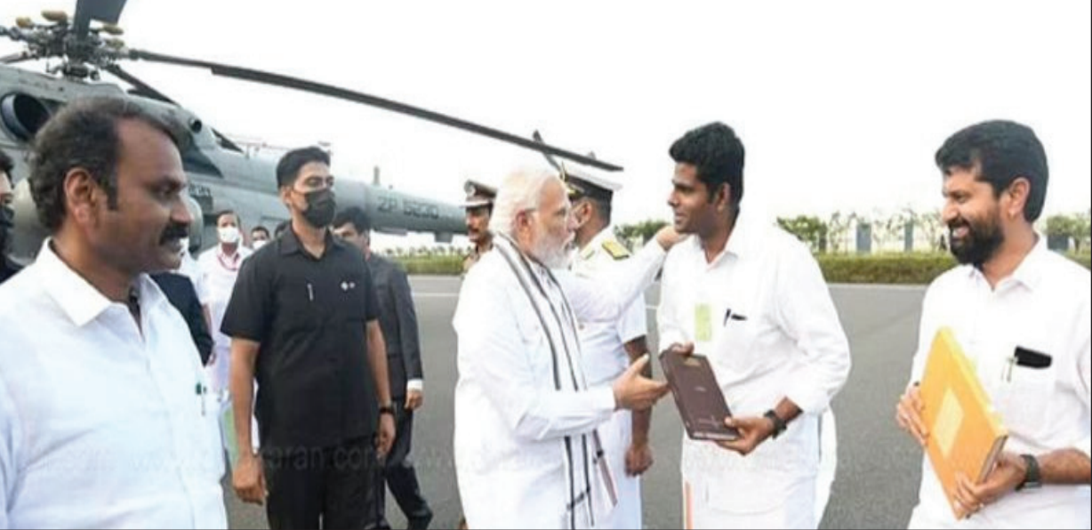
சென்னையில் பிரதமர் நேர்த்திர மோடி நடத்தும் ஆலோசனைக் கூட்டத்தில் கட்டாயம் பங்கேற்க அண்ணாமலைக்கு பிரதமர் அழைப்பு விடுத்ததுள்ளார். பிரதமர் மோடி ஆலோசனைக் கூட்டத்தில் கட்டாயம் பங்கேற்க வேண்டும் என பா.ஜ.க தேசியத் தலைமை அறிவுறுத்தல் காரணமாக கேரளாவில் இருந்து சென்னை விரைகிறார் அண்ணாமலை.