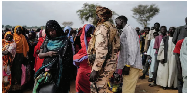
கார்ட்டும், ஏப். 14-

பசி கொடுமையின் உச்சம் தூடானில் இலை தழைகளை தின்று உயிர் வாழும் மக்கள்!