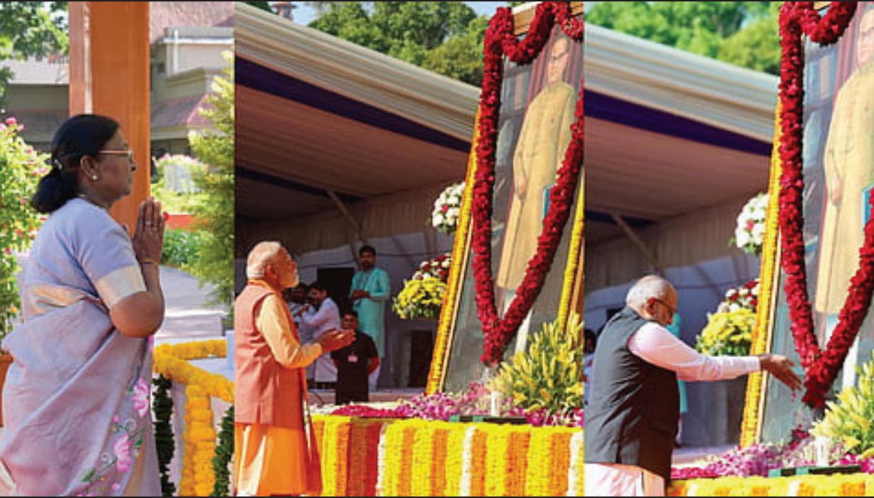
பாராளுமன்ற வளாகத்தில் அம்பேத்கர் படத்திற்கு தலைவர்கள் மரியாதை செலுத்தினர்.