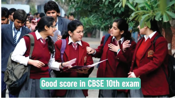
Good score in CBSE 10th exam

புதுடெல்லி, ஏப். 24- மத்திய இடைநிலைக் கல்வி வாரியம் (சி.பி.எஸ்.இ.), 10-ம் வகுப்பு மாணவர்களுக்கான 2-வது பொதுத்தேர்வு கால அட்டவணையை வெளியிட்டு உள்ளது. இத்தேர்வுகள் மே 15-ம் தேதி தொடங்கி நடைபெற உள்ளன. சி.பி.எஸ்.இ வரலாற்றில் முதன்முறையாக இந்த ஆண்டு 2 பொதுத்தேர்வு முறை அறிமுகப்படுத்தப்பட்டுள்ளது. இதன் மூலம், ஏற்கனவே பிப்ரவரி மாதம் நடந்த முதன்மைப் பொதுத்தேர்வில் தேர்ச்சி பெற்ற மாணவர்கள், தங்கள் மதிப்பெண்களை உயர்த்திக்கொள்ள அதிகபட்சமாக 3 பாடங்களில் மீண்டும் தேர்வு எழுத வாய்ப்பு வழங்கப்படுகிறது. அனைத்து தேர்வுகளும் காலை 10:30 மணி முதல் மதியம் 01:30 மணி வரை ஒரே விபீட்டில் நடைபெறும் எனத் தெரிவிக்கப்பட்டுள்ளது.