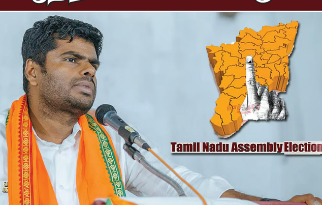
Tamil Nadu Assembly Election

சென்னை, ஏப். 02- பா.ஜ.க. வேட்பாளர்கள் பட்டியலை எந்த நேரத்திலும் கட்சி தலைமை அறிவிக்கும் என எதிர்பார்க்கப்பட்டு வருகிறது. இந்த சூழலில் அந்த வேட்பாளர் பட்டியலில் பா.ஜ.க. முன்னாள் மாநில தலைவர் அண்ணாமலையின் பெயர் இருக்கிறதா? அவர் எந்த தொகுதியில் போட்டியிட இருக்கிறார்? என்ற எதிர்பார்ப்பும் பா.ஜ.க. தொ ண்டர்கள் மத்தியில் இருந்து வருகிறது. இதனிடையே கட்சி மேலிடம் அவரை மொடக்குறிச்சி தொகுதியில்