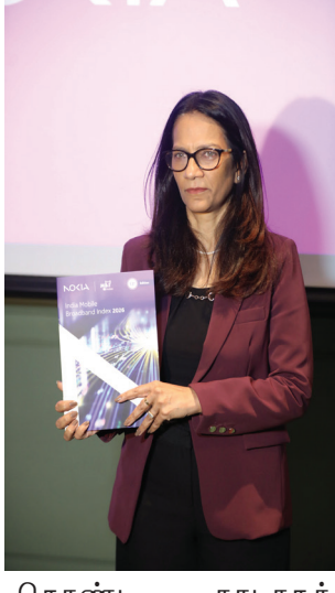
கொண்ட நாடாகத் திகழ்கிறது. மேலும், 4K வீடியோ ஸ்ட்ரீமிங், கிளவுட்

கேமிங் மற்றும் செயற்கை நுண்ணறிவு பயன்பாடுகள் அதிகரித்ததன் காரணமாக டேட்டா தேவையும் தொடர்ந்து உயர்ந்து வருகிறது. 2025 ஆம் ஆண்டில் மொத்த டேட்டா டிராஃபிக் மாதத்திற்கு 27 எக்ஸாபைட்டுடாக கடந்துள்ளதுடன், மெட்ரோ நகரங்களில் 5G பயன்பாடு 58% வரை உயர்ந்துள்ளது. அதேசமயம், 5G ஸ்மார்ட்போன்களின் அதிகரித்த கிடைத்தால் நாட்டின் பல்வேறு பகுதிகளிலும் 5G விரிவடைந்து வருகிறது. இந்த வளர்ச்சி குறித்து