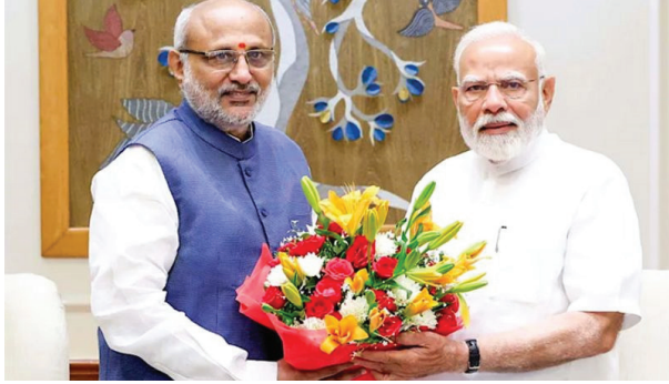
ஜனநாயக விழுமியங்களின் மீதான அவரது ஆழ்ந்த அர்ப்பணிப்பைப் பிரதிபலிக்கின்றன என பிரதமர் மோடி புகழாரம் சூட்டினார்.

புதுடெல்லி, மே. 04- துணை ஜனாதிபதி சி.பி. ராதாகிருஷ்ணன் அவர்களுக்கு மனமார்ந்த பிறந்தநாள் வாழ்த்துக்கள். விக்கிவித் பாரதம் என்ற நமது கூட்டு கனவை வலுப்படுத்த அவர் எண்ணற்ற முயற்சிகளை மேற்கொண்டு வருகிறார். நமது நாடாளுமன்ற நடவடிக்கைகளின் செயல்திறமையும், பயனுடைமையையும் மேம்படுத்துவதற்கான அவரது தொடர்ச்சியான முயற்சிகள்,