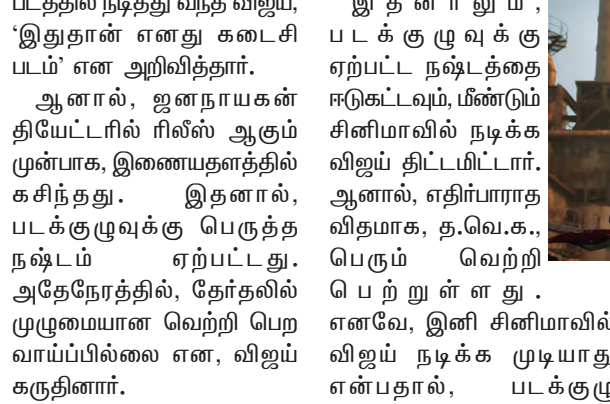
படத்தில் நடித்து வந்த விஜய், 'இதுதான் எனது கடைசி படம்' என அறிவித்தார். ஆனால், ஜனநாயகன் தியேட்டரில் ரிலீஸ் ஆகும் முன்பாக, இணையதளத்தில் கசிந்தது. இதனால், படக்குழுவுக்கு பெருந்த நஷ்டம் ஏற்பட்டது. அதே நேரத்தில், தேர்தலில் முழுமையான வெற்றி பெற வாய்ப்பில்லை என, விஜய் கருதினார்.

சென்னை, மே. 05- தேர்தலில் பெரும் வெற்றி பெற்றதால், சினிமாவில் இருந்து முழுமையாக விலகும் முடிவை, த.வெ.க., தலைவர் விஜய் எடுத்துள்ளார். இதுகுறித்து, த.வெ.க., வட்டாரங்கள் கூறியதாவது: நடிக்க விஜய், 2024ம் ஆண்டு ஏப்ரல் மாதம் த.வெ.க., எனும் கட்சியை தொடங்கினார். அந்த சமயத்தில், ஜனநாயகன்