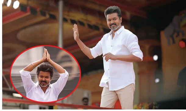
வேண்டும். அவ்வாறு செய்தால், தொகுதிகளின் எண்ணிக்கையில் ஒன்று குறையும். அதே நேரத்தில், அக்கட்சியில் வெற்றி பெற்ற வேட்பாளர்களில் ஒருவர் சபாநாயகராக நியமிக்கப்பட வேண்டும். நம்பிக்கை வாக்கெடுப்பின் போது, சபாநாயகர் வாக்களிக்கும் முடியாது என்பதால், மேலும் ஒரு இடம் குறையும். அப்படி, பார்க்கும்போது, த.வெ.க.வுக்கு பெரும்பான்மையை நிரூபிக்க மேலும் 12 உறுப்பினர்களின் ஆதரவு தேவை. தற்போதைய நிலையில், தி.மு.க. கூட்டணியில் இடம் பெற்றுள்ள காங்கிரஸ் கட்சிக்கு 6 இடங்களும், இரு கம்யூனிஸ்டு கட்சிகளுக்கு தலா 2 தொகுதிகள் வீதம் 4 இடங்களும், தே.மு.தி.க.விற்கு 1 இடமும், இந்திய யூனியன் முஸ்லிம் லீக்கிற்கு

சென்னை, மே. 05- தமிழக சட்டசபை தேர்தலில் யாரும் எதிர் பாராத வகையில் த.வெ.க. வெற்றி பெற்று, 59 ஆண்டு கால திராவிட கட்சிகளின் ஆதிக்கத்துக்கு முற்றுப்புள்ளி வைத்துள்ளது. முதல் தேர்தலிலேயே வெற்றி வாகை சூடி, அங்கீகரிக்கப்பட்ட அரசியல் கட்சியாக உயர்ந்துள்ளது. என்றாலும், தனிப்பெரும்பான்மையுடன் ஆட்சி அமைக்கும் அளவுக்கு த.வெ.க.வுக்கு வெற்றி கிடைக்கவில்லை. அதாவது, மொத்தம் உள்ள 234 தொகுதிகளில் 118 தொகுதிகளில் வெற்றி பெற்றால்தான், ஒரு கட்சிக்கு தனிப் பெரும்பான்மை கிடைக்கும். ஆனால், த.வெ.க. 108 தொகுதிகளில் தான் முன்னிலை வகிக்கிறது. த.வெ.க.வுக்கு தனிப் பெரும்பான்மை கிடைக்காத நிலையில், அடுத்து உள்ள நடக்கும் என்பதை தொடர்ந்து பார்ப்போம்.