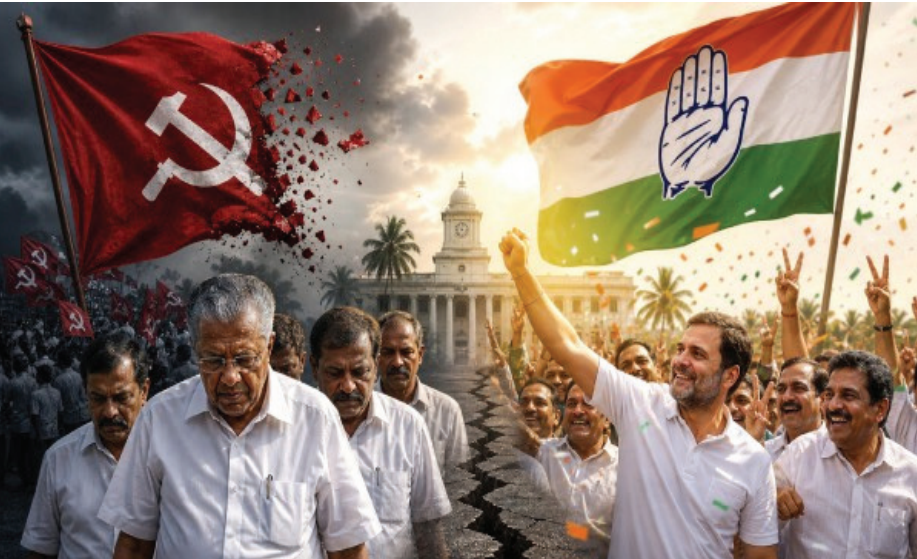
இறங்கியுள்ளது. கேரளா இதுவரை இடதுசாரி அரசியலின் வலுவான தளமாகக் கருதப்பட்டது. ஆனால் இந்த தேர்தலில் ஏற்பட்ட தோல்வி இந்திய அரசியலில் ஒரு முக்கிய திருப்புமுனையாகப் பார்க்கப்படுகிறது. கடைசி கோட்டை கேரளா இடதுசாரி அரசியலுக்கு மிகவும் முக்கியமானது. மேற்கு வங்கம், திரிபுரா போன்ற மாநிலங்களில் இடதுசாரிகள் ஆட்சியை இழந்த பிறகும், கேரளா மட்டும் தொடர்ந்து இடதுசாரிகளுக்கு வலுவான ஆதரவைத் தந்து வந்தது.

சென்னை, மே. 05- தமிழ்நாட்டு தேர்தல் முடிவுகளுக்கு சற்றும்குறைவில்லாமல் கேரளா சட்டமன்றத் தேர்தல் முடிவுகளும் பரபரப்பை ஏற்படுத்தியுள்ளது. கேரளாவில் ஆட்சி மாற்றம் உறுதியாகியுள்ளது. கேரள சட்டமன்றத் தேர்தலில் காங்கிரஸ் தலைமையிலான ஐக்கிய ஜனநாயக முன்னணி (UDF) மொத்தம் உள்ள 140 இடங்களில் 99 இடங்களில் வெற்றி பெற்றுள்ளது... கம்யூனிஸ்ட் கட்சி (மார்க்சிஸ்ட்) தலைமையிலான இடதுசாரி ஜனநாயக முன்னணி (எல்.டி.எஃப்.) இரண்டு முறை தொடர்ச்சியாக ஆட்சியில் இருந்த பிறகு தற்போதையை தேர்தலில் பெரும் பின்னடைவை சந்தித்துள்ளது. 2016 முதல் ஆட்சியில் இருந்த எல்.டி.எஃப். அரசு தற்போது அரியணையை விட்டு