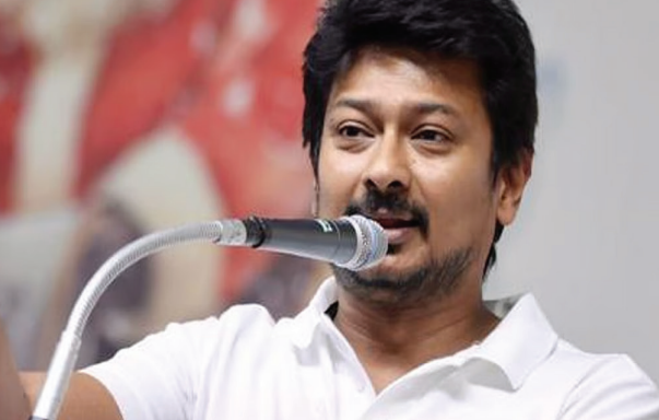
ஏற்பட்டுள்ளது. இதனிடையே மீண்டும் ஆட்சியை பிடிப்போம் என்ற அயராது நம்பிக்கையில் இருந்த தி.மு.க. 54 இடங்களில் வெற்றி பெற்று எதிர்க்கட்சி

சென்னை, மே. 05- நடந்து முடிந்த தமிழக சட்டசபை தேர்தலில் தமிழக வெற்றிக்கழகம் 108 இடங்களில் வெற்றி பெற்றுள்ளது. 233 தொகுதிகளில் தனித்து போட்டியிட்ட த.வெ.க. 108 இடங்களில் வெற்றி பெற்று தமிழக அரசியலில் வரலாற்று சாதனை படைத்துள்ளது. இருப்பினும் எந்த கட்சிக்கும் பெரும்பான்மை கிடைக்காததால் தமிழகத்தில் கூட்டணி ஆட்சி அமையும் சூழல்