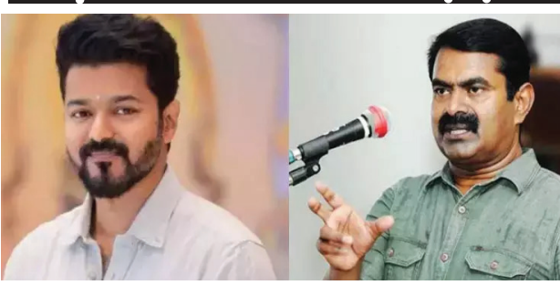
சென்னை, மே. 05- 2026 சட்டசபை தேர்தல் முடிவுகள், நாம் தமிழர் கட்சிக்கு அரசியல் வரலாற்றி வேலே மிகப் பெரிய பின்னடைவை ஏற்படுத்தியுள்ளது. 2021 சட்டமன்றத் தேர்தலில் 6.6% வாக்குகளுடன் மூன்றாவது பெரிய

வாக்கு வங்கியாக இருந்த நாம் தமிழர் கட்சி, இந்த முறை 4% க்கும் கீழ் சரிந்துள்ளது. இது கட்சியின் எதிர்காலத்திற்கு மிகப் பெரிய சவாலாக மாறியுள்ளது. மாநிலக் கட்சி அங்கீகாரத்தை இழக்கும் அபாயம் தற்போது எழுந்துள்ளது.