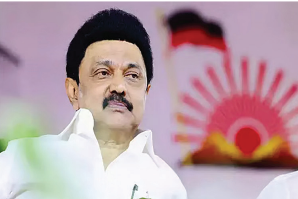
தலைமையிலான மதச்சார்பற்ற முற்போக்குக் கூட்டணிக் கட்சியின் வேட்பாளர்களுக்கு வாக்களித்த தமிழக மக்கள் அனைவருக்கும் எனது மனமார்ந்த நன்றியை உண்மை உணர்வுடன் தெரிவித்துக் கொள்கிறேன். உங்கள் அனைவரின் ஒவ்வொரு வாக்கையும் விலைமதிப்பற்ற நம்பிக்கையாக நான் கருதுகிறேன். இப்போது வரை கிடைத்துள்ள புள்ளிவிபரங்களின்படி திமுக கூட்டணிக்கு 1 கோடியே 54 லட்சத்து 82 ஆயிரத்து 782 வாக்குகள் கிடைத்துள்ளன. இம்மக்கள் அனைவருக்கும் எனது நெஞ்சார்ந்த நன்றியை நான் தெரிவித்துக் கொள்கிறேன்.

சென்னை மே. 05- கொள்தூர் தொகுதியில் போட்டியிட்ட ஸ்டாலின் தோல்வி அடைந்த நிலையில் முதல்வர் பதவியை ராஜினாமா செய்தார். அவர் ராஜினாமா கடிதத்தை கவர்னருக்கு அனுப்பினார். இதற்கிடையே சமூக வலைதளத்தில் அவர் வெளியிட்டுள்ள பதிவில் கூறியிருப்பதாவது: நடந்து முடிந்த தமிழக சட்டசபை பொதுத் தேர்தலில் திமுக