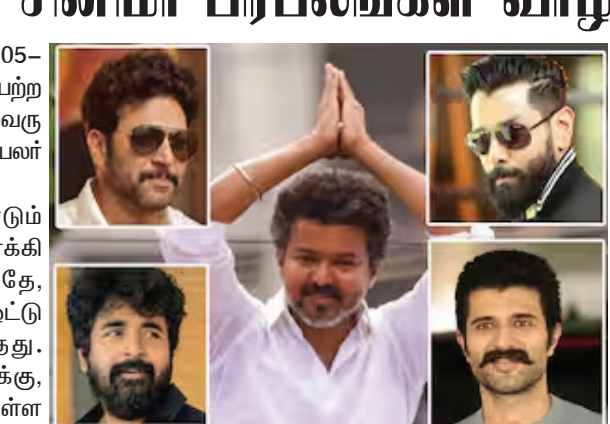
நம் காலத்தில் இதை நேரில் கண்டதற்கு மகிழ்ச்சி. நடிக்க ரூ.1: இந்த மா பெரும் வெற்றிக்கு மனமார்ந்த வாழ்த்துக்கள். விஜயும் அவரது குழுவினரும் பொது சேவையில் மேலும் உயர்ந்து, எண்ணற்ற மைல்கற்களை அடைய நல்வாழ்த்துக்கள். நடிக்க காஜல் அகர்வால்: உதவேகம் தரும் இந்த புதிய அத்தியாயத்தில், நீங்கள் அடியெடுத்து வைக்கும்போது, உங்களுக்கு மிகுந்த வலிமையுடன் வெற்றியும் கிடைக்க வாழ்த்துகிறோம். பலரும் எதிர்பார்க்கும் மாற்றத்தை நீங்கள் கொண்டு வருவீர்களாக.

சென்னை, மே. 05- தமிழக தேர்தலில் வெற்றி பெற்ற நடிக்கும், த.வெ.க., கட்சி தலைவராக மாண விஜய்க்கு திரையுலகினர் பலர் வாழ்த்து தெரிவித்துள்ளனர். நடிக்க விரும்பும் ஓட்டு போடும் போது, வெள்ளை சட்டை, காக்கி பேன்ட் அணிந்து வந்தபோதே, அவர் த.வெ.க.,வுக்கு தான் ஓட்டு போட்டார் என்பது தெரிந்தது. இந்நிலையில் விஜய் வெற்றிக்கு, 'எக்ஸ்' தளத்தில், விஜயுடன் உள்ள போட்டோவை பகிர்ந்து, 'வாழ்த்துக்கள் நண்பா... இன்று ஒரு வரலாறு படைத்து விட்டாய்' எனக் கூறி, வாழ்த்தியுள்ளார்.