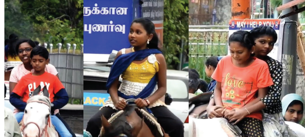
Tourist Horse Riding Kodaikanal

தமிழக கால்நடை பராமரிப்புத்துறை பிறப்பித்துள்ள உத்தரவு: சென்னை தில் குதிரைகளுக்கு கிளண்டால் பாக்கீரியா தொற்று பரவல் எதிரொலி காரணமாக, குதிரை சவாரிக்கு உடல் நலக் குறைவாக உள்ள குதிரைகளை பயன்படுத்த வேண்டாம்.