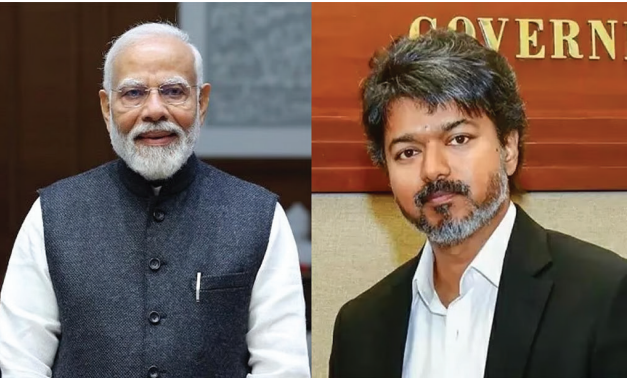
இந்நிலையில் முதலமைச்சர் விஜய் அடுத்த வாரம் டெல்லி செல்ல உள்நடக்க தகவல் வெளியாகி உள்ளது. அடுத்த வாரம் டெல்லி செல்லும் அவர் பிரதமர் மோடி,

சென்னை, மே. 22- தமிழ்நாடு முதலமைச்சராக கடந்த 10-ந் தேதி விஜய் பதவியேற்றார். பதவி ஏற்ற நாளில் இருந்து தினமும் தலைமைச் செயலகம் வந்து அவர் பணியாற்றி வருகிறார். புதிய அரசு அமைந்த உடன் மரியாதை நிமித்தமாக முதலமைச்சர் விஜய், திமுக தலைவர் மு.க.ஸ்டாலின், மதிமுக பொதுச்செயலாளர் வைகோ, விசிக தலைவர் திருமாவளவன் ஆகியோரை சந்தித்தார்.