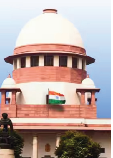
சப்ரீம்கோர்ட்டின் முக்கிய அம்சங்கள்:

புதுடெல்லி, மே. 27 - இந்திய தேர்தல் கமிஷனின் சிறப்பு வாக்காளர் பட்டியல் திருத்தத்திற்கு (எஸ்.ஆர்.சி) எதிரான வழக்கில் இன்று (மே 27) சப்ரீம்கோர்ட்டில் அதிர்வு தீர்ப்பு அளித்தது. வாக்காளர் பட்டியல் சிறப்பு தீவிர திருத்தம் (எஸ்.ஆர்.சி) செய்யும் பணி சரியானதே என நீதிபதிகள் தெரிவித்தனர்.