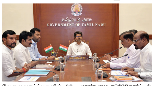
வேலைவாய்ப்புகளில் 69 சதவீத இடஒதுக்கீட்டிற்கு எதிராக மாண்புமிகு சப்ரீம்கோர்ட்டில் தொடரப்பட்டுள்ள வழக்குகள் தொடர்பான ஆய்வுக் கூட்டம் நடைபெற்றது. தமிழ்நாட்டிலுள்ள கல்வி நிலையங்களில் மாணவர் சேர்க்கை மற்றும் 69 சதவீத இடஒதுக்கீட்டினை பாதுகாக்கும் நோக்கில், நடவடிக்கைகளை துரிதமாக மேற்கொள்ள தமிழ்நாடு முதல்-அமைச்சர் அவர்கள் அறிவுரைகளை வழங்கினார்கள்.

சென்னை, மே. 27 - தமிழ்நாடு முதல்-அமைச்சர் ஜோசப் விஜய் தலைமையில் தமிழ்நாட்டின் கல்வி நிலையங்களில் மாணவர் சேர்க்கை மற்றும் அரசு வேலைவாய்ப்புகளில் 69 சதவீத இடஒதுக்கீட்டிற்கு எதிராக சப்ரீம்கோர்ட்டில் தொடரப்பட்டுள்ள வழக்குகள் தொடர்பான ஆய்வுக் கூட்டம் நடைபெற்றது.