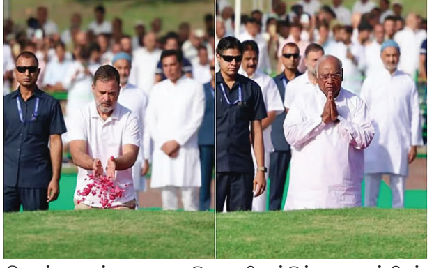
கொள்கைகள், நமது நாடு வளர்ச்சிப் பாதையில் செல்ல நமக்குத் தொடர்ந்து வழிகாட்டும் என காங்கிரஸ் கட்சி தனது சமூக வலைதளப் பதிவில் குறிப்பிட்டுள்ளது.

புதுடெல்லி, மே. 27 - முன்னாள் பிரதமர் நேருவின் நினைவு நாளான தலைவர்கள் பலரும் அஞ்சலி செலுத்தி வருகின்றனர்.