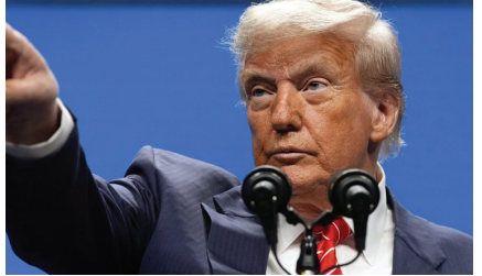
ஈரானின் முன்மொழிவை நிராகரிக்கிறேன். ஓமனும் மற்றவர்களைப் போலவே நடந்துகொள்ளும். இல்லையென்றால்,

ஈரான், மே. 29 - ஹார்முஸ் ஜலசந்தியை ஓமனுடன் சேர்ந்து கூட்டாக நிர்வகிக்க இருப்பதாக ஈரான் முன்மொழிந்திருப்பதாகத் தகவல்கள் வெளியாகின. இதுபற்றி வெள்ளை மாளி கையில் செய்தியாளர்களிடம் பேசிய அதிபர் டிரம்ப், சர்வதேச மேற்கொள்ளப்பட்ட ஹார்முஸ் ஜலசந்தியை யாரும் கட்டுப்படுத்த முடியாது. ஹார்முஸ் ஜலசந்தியை நிர்வகிப்பது குறித்த