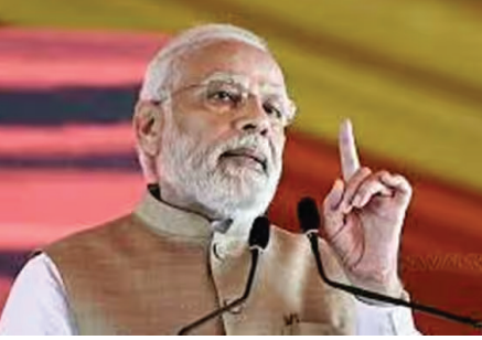
சார்ந்த செயல்பாடு ஆகியவை தீர்வு தருவதாக அமையும். இதற்கு மத்திய பிரதேசம் மற்றும் உத்தர பிரதேசம் இடையே செயல்படுத்தப்படும், 'கென் - பெத்வா' திட்டம் சிறந்த முன்னுதாரணம். 'கென் - பெத்வா' நதிநீர் இணைப்பு திட்டத்தின் பாணியில், பிற

புதுடில்லி, மே. 29 - மத்திய - மாநில அரசுகளின் ஒருங்கிணைந்த உட்கட்டமைப்பு திட்டங்களை ஆய்வு செய்யும் 51வது, 'பிரகதி' ஆலோசனை கூட்டம், பிரதமர் மோடி தலைமையில் நேற்று முன்தினம் மாலை நடந்தது. ரயில்வே, மின்சாரம் மற்றும் சாலை வசதிகள் துறைகளின் கீழ், 30,000 கோடி ரூபாய் மதிப்பில் ஒன்பது மாநிலங்களில் செயல்படுத்தப்படவுள்ள ஏழு முக்கிய திட்டங்கள் குறித்து உரிமை அலுவலர் மேற்கொள்ளப்பட்டது. அப்போது பிரதமர் மோடி கூறியதாவது: மாநிலங்களுக்கு இடையிலான நதிநீர் பங்கிட்டு பிரச்சனைகளுக்கு ஒத்துழைப்பு, உரிய காலத்தில் ஒப்புதல், தொழில்நுட்ப ரீதியில் கண்காணிப்பு மற்றும் இயக்கம்