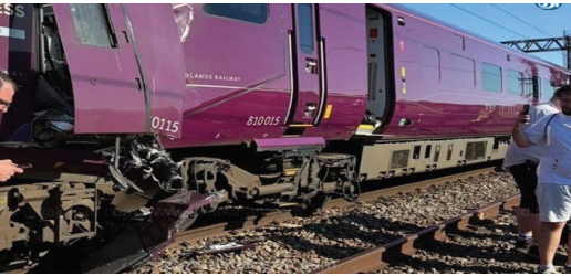
ஓட்டுநர் பலியானார். 90 பேர் காயம் அடைந்தனர். அவர்களில் பலருக்கு பலத்த காயம் ஏற்பட்டு உள்ளது. இதனால் உயிரிழப்பு அதிகரிக்கக் கூடும் என அச்சப்படுகிறது. இந்த விபத்தில், காயமடைந்தவர்கள் மீட்கப்பட்டு சிகிச்சைக்கு கொண்டு செல்லப்பட்டு உள்ளனர். குண்டு வெடித்தது போன்று உணர்ந்தேன் என்று, அதனை பார்த்த, ரெயிலின்

லண்டன், ஜூன். 20- இங்கிலாந்து நாட்டின் லண்டன் நகருக்கு வடக்கே பெட்போர்டு நகருக்கு தெற்கே மத்திய லண்டன் நகர் பகுதியில் இருந்து மத்திய இங்கிலாந்து பகுதிகளுக்கு பயணிகளை கொண்டு செல்லும் வழியில் வழக்கம்போல் ரெயில்கள் சென்று கொண்டிருந்தன. அப்போது, 2 ரெயில்கள் ஒன்றுடன் ஒன்று மோதி விபத்தில் சிக்கின. இந்த சம்பவத்தில் ஒரு ரெயில்