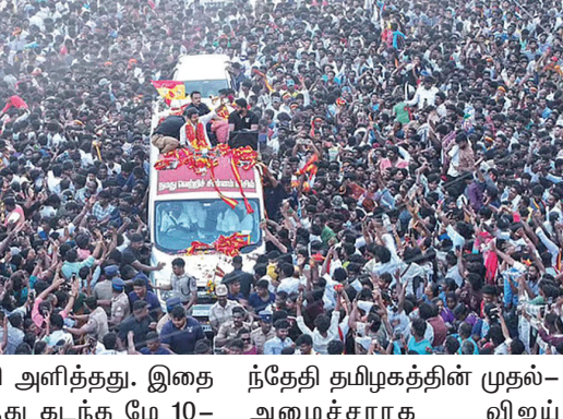
அதிர்ச்சி அளித்தது. இதை ந்தேதி தமிழகத்தின் முதல்-அமைச்சராக விஜய்

சென்னை, ஜூன். 20- த.வெ.க.வின் உறுப்பினர் சேர்க்கை தற்போது 2 கோடியை கடந்துள்ளது. நடந்து முடிந்த சட்டசபை தேர்தலில் முதல் முறையாக தேர்தல் களம் கண்ட த.வெ.க. 108 இடங்களை கைப்பற்றி தனி பெரும் கட்சியாக உருவெடுத்தது. 34.92 சதவீத வாக்குகளை அளித்த தி.மு.க., அதி.மு.க. பாரம்பரிய கட்சிகளுக்கு