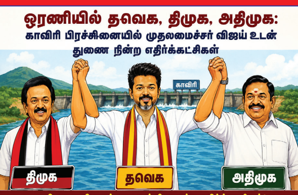
தமிழக உரிமைக்காக ஒன்றிணைந்த எதிர்க்கட்சிகள்! காவிரி நீர் உரிமை - தமிழர்களின் உரிமை!

காவிரி நதி நீர் பங்கீடு விவகாரம் மற்றும் மேகதாதுவில் அணை கட்டும் கர்நாடகாவின் முயற்சிக்கு எதிராக தமிழக சட்டசபையில் முதலமைச்சர் விஜய் மேகதாது அணை விவகாரம் தொடர்பாக அரசின் தனி தீர்மானம் கொண்டு வந்தார். இதற்கு அனைத்து கட்சி உறுப்பினர்களும் ஆதரவு தந்து தீர்மானத்தை ஒருமனதாக நிறைவேற்றினர். காவிரி நடுவர் மன்றம் 5-2-2007 அன்று அளித்த இறுதித் தீர்மானம், உச்சநீதிமன்றம் 16-2-2018 அன்று அளித்த தீர்மானம் மதிக்காமல், சம்பந்தப்பட்ட படுகை மாநிலங்களின் இசைவை பெறாமல், மத்திய அரசின் எந்தவித அனுமதியும் பெறாமல் கர்நாடக அரசு தன்னிச்சையாக காவிரி நதியின் குறுக்கே மேகதாதுவில் அணை கட்ட முயற்சி மேற்கொள்வதை எந்த வகையிலும் ஏற்றுக்கொள்ள முடியாது என்பதால், கர்நாடக அரசின் இச்செயலுக்கு கடுமையான எதிர்ப்பை தமிழ்நாடு தெரிவிக்கிறது என முதலமைச்சர் விஜய் பேரவையில் கூறினார்.