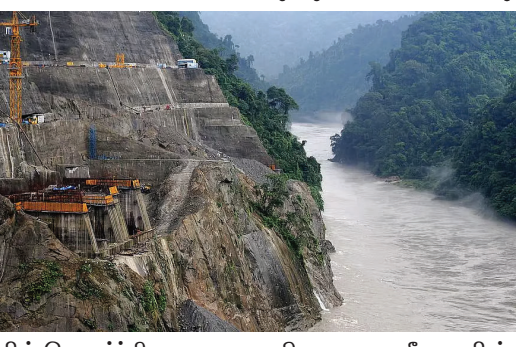
இந்தியாவின் தொடர்ச்சியான எதிர்ப்புகளையும் மீறி பெய்ஜிங் இந்தத் திட்டத்தை வேகமாக முன்னெடுத்து வருகிறது. சீனாவின் அணையில் இருந்து திடீரென நீர் திறந்துவிடப்படுவதைத் தடுக்கும் ஒரு

புதுடெல்லி, ஜூன். 20- இந்திய எல்லையிலிருந்து சுமார் 50 கிலோமீட்டர் தொலைவில், திபெத்தியப் பகுதியில் உலகின் மிகப்பெரிய நீர்மின் அணையாக அமைக்கப்படும் திட்டத்தின் கட்டுமானத்தை சீனா தொடங்கியுள்ளது. இது குறித்து உள்வகுத்துறையின் பிரதம துணை அமைச்சர் மீர்திபென்ஜிங் இந்தத் திட்டத்தை வேகமாக முன்னெடுத்து