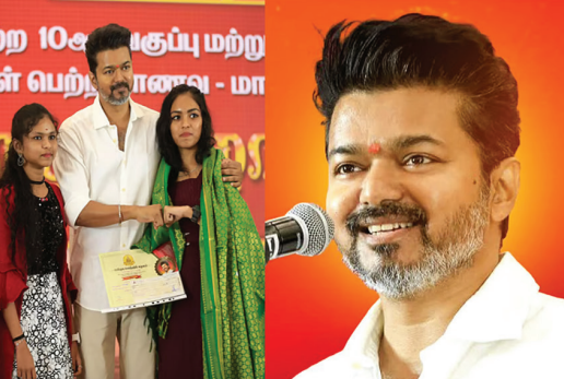
இந்த ஆண்டு 10, 12-ம் வகுப்பு பொதுத்தேர்வில் மாவட்ட அளவில் முதல் 3 இடங்களை பிடித்தவர்களுக்கான விருது வழங்கும் விழாவில் மாணவர்கள் பெற்றோர் மானம் - மா

சென்னை, ஜூன். 20- தமிழக முதல்-அமைச்சர் விஜய் அரவணக்கு வகுவதற்கு முன்பாகவே 10, 12-ம் வகுப்பு தேர்வில் மாவட்ட அளவில் முதல் 3 இடங்களை பிடிக்கும் மாணவ-மாணவிகளுக்கு விருது வழங்கி கவுரவித்து வருகிறார். அந்தவகையில் 4-வது ஆண்டாக பரிசளிப்பு விழா விரைவில் நடக்க இருக்கிறது.