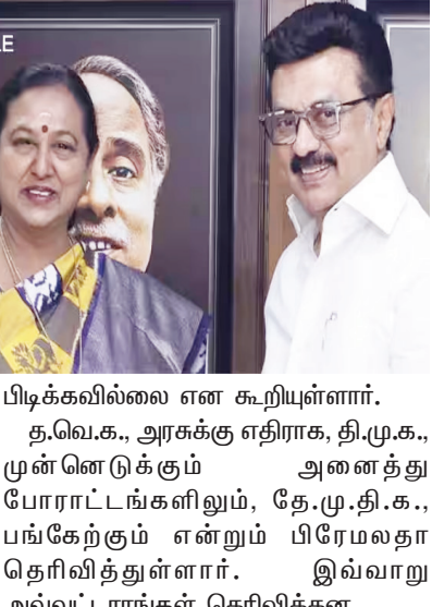
பிடிக்கவில்லை என கூறியுள்ளார்.