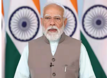
ஸ்ரீமன் பிரதமர் மோடி

புதுடெல்லி, ஜூன் 14 - அனைவருக்கும் மலிவு விலையில் சுகாதார வசதிகள் கிடைக்க இந்தியா பாடுபட்டு வருகிறது என பிரதமர் மோடி தெரிவித்தார். அவரது பதிவு: கடந்த 12 ஆண்டுகளாக, தரமான சுகாதார வசதிகளை மலிவு விலையிலும் அனைவருக்கும் எளிதில் கிடைக்கக் கூடியதாகவும் மாற்றுவதற்கு இந்தியா பாடுபட்டு வருகிறது. மிகவும் நலிவடைந்த மக்களுக்கு உயர் தர சுகாதார சேவைகளை வழங்கும் உலகின் மிகப்பெரிய சுகாதாரத் திட்டமான ஆயுஷ்மான் பாரத் திட்டத்தை அறிமுகம் செய்ததில் நாங்கள் பெருமிதம் கொள்கிறோம். பிரதம மந்திரி பாரதிய ஜன் ஓளஷதி பரியோஜனா போன்ற பிற முயற்சிகள் மருந்துகளின் விலையைக் குறைத்துள்ளன.